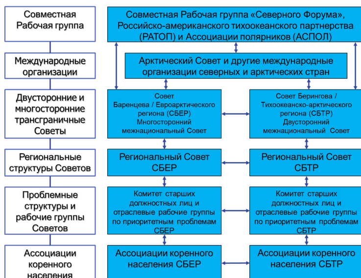
Рис. 4. Принципиальная схема контактов совместной Рабочей группы «Северного Форума», Российско-Американского Тихоокеанского партнерства (РАТОП) и Ассоциации полярников (АСПОЛ) с основными международными и трансграничными Советами северных и арктических стран и регионов мира

Новая инициатива «Северного Форума», если она будет выдвинута этой организацией, наверняка получит реальную поддержку подавляющего большинства и национальных, и международных организаций, действующих в зоне Севера и Арктики. Эта инициатива будет весьма своевременной и получит