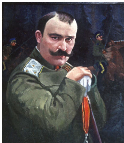
Рис. 1. В расцвете сил...

свирепым оказался режим семёновской «белой государственности», установленной в Забайкалье.