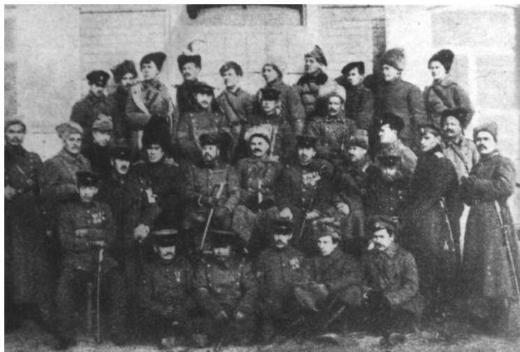
Рис. 2. Семёнов (в центре) на очередной встрече с японскими «друзьями»

ков-забайкальцев свидетельствуют следующие данные: от рук семёновских белогвардейцев и японских интервентов погибли около 102 тыс. чел., т.е. каждый пятый-шестой житель Забайкалья. Десятки тысяч забайкальцев прошли через одиннадцать семёновских застенков-лагерей смерти, откуда живыми, за редким исключением, не возвращались. В самом страшном Маккавеевском застенке были замучены и уничтожены не менее 5 тыс. заключенных. Сегодня эта цифра стараниями инициаторов реабилитации атамана сознательно «снижена» до 300, а затем — до 190 жертв.